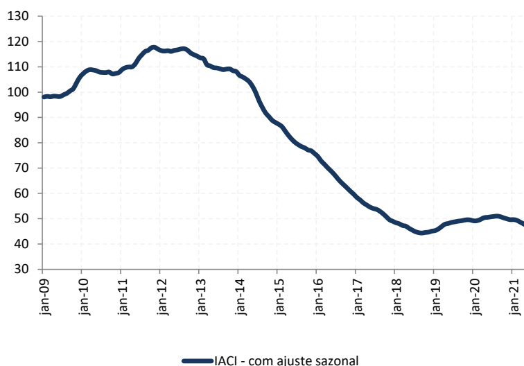
Figura 1: Índice de Atividade da Construção Imobiliária (IACI), com ajuste sazonal (média 2009=100)

A metragem quadrada em construção medida pelo IACI apresentou recuo de 1,2% em junho ante maio, na série com ajuste sazonal. Em relação ao mesmo período de 2020, houve retração de 7,9%.