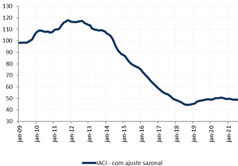
Figura 1: Índice de Atividade da Construção Imobiliária (IACI), com ajuste sazonal (média 2009=100)

A metragem quadrada em construção medida pelo IACI recuou 0,4% em setembro ante agosto, na série com ajuste sazonal. Em relação ao mesmo período de 2020, houve retração de 4,4%.