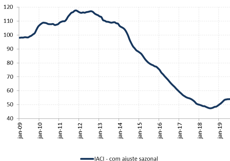
Figura 1: Índice de Atividade da Construção Imobiliária (IACI), com ajuste sazonal (média 2009=100)

A metragem quadrada em construção medida pelo IACI apresentou recuo de 1,2% em setembro ante o mês de agosto, na série com ajuste sazonal. Em relação ao mesmo período de 2018, houve crescimento de 11,3%. Dessa forma, o IACI registra crescimento de 9,3% no acumulado até setembro, frente ao mesmo período do ano passado.