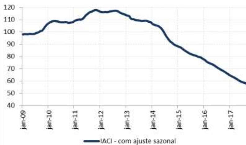
Figura 1: Índice de Atividade da Construção Imobiliária (IACI), com ajuste sazonal (média 2009=100)

A metragem quadrada em construção medida pelo IACI apresentou queda de 2,7% em setembro ante agosto, quando registrou queda de 1,0% na série com ajuste sazonal. Em relação ao mesmo mês de 2016, o índice mostrou retração de 17,5%. Em 12 meses, a atividade de construção imobiliária acumula queda de 16,9%.