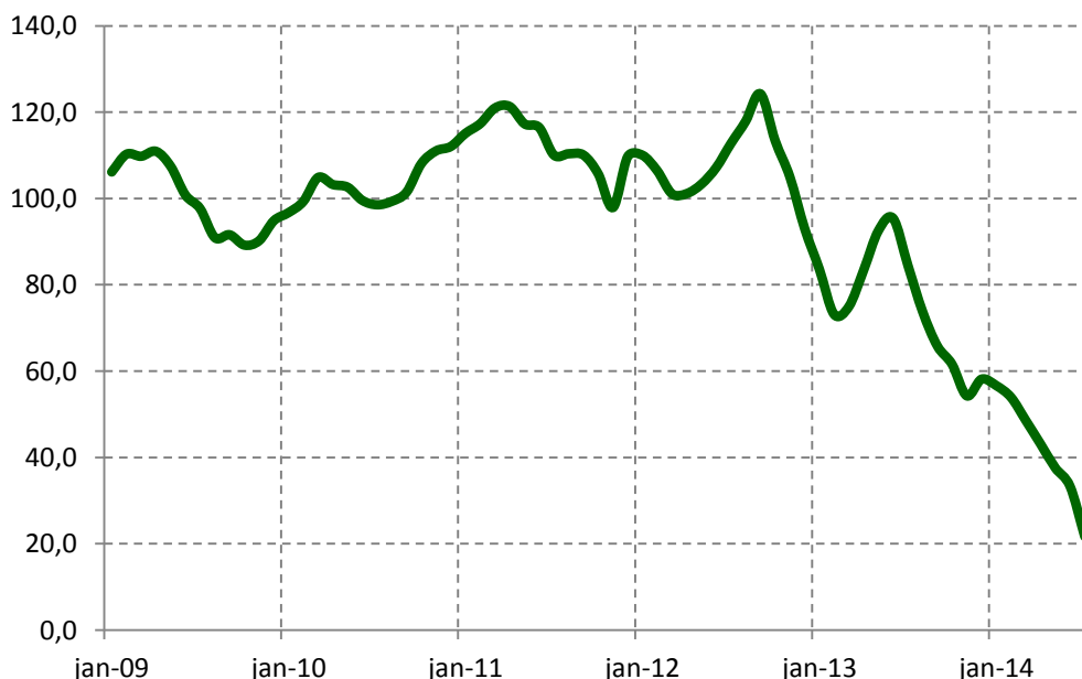
Figura 2: Índice de Atividade da Construção Imobiliária – Lançamento (IACI-L), com ajuste sazonal (média 2009=100)

O índice de lançamento imobiliário (IACI-L), que mede a metragem lançada no País e aponta o ritmo da construção nos próximos meses, aprofundou o movimento de queda em julho. O total de área útil lançada no País recuou 34,9% em relação a junho, considerando dados com ajuste sazonal. O nível do índice está 74,3% abaixo do verificado no mesmo período do ano passado. No acumulado do ano (média de janeiro a julho deste ano ante mesmo período do ano passado) houve recuo de 50,8%. O fraco resultado de lançamentos reflete o elevado nível de estoque de imóveis, o menor ritmo de vendas e a perda da confiança dos empresários. Provavelmente, isso irá se refletir na continuidade da queda do índice geral de atividade da construção imobiliária nos próximos meses.