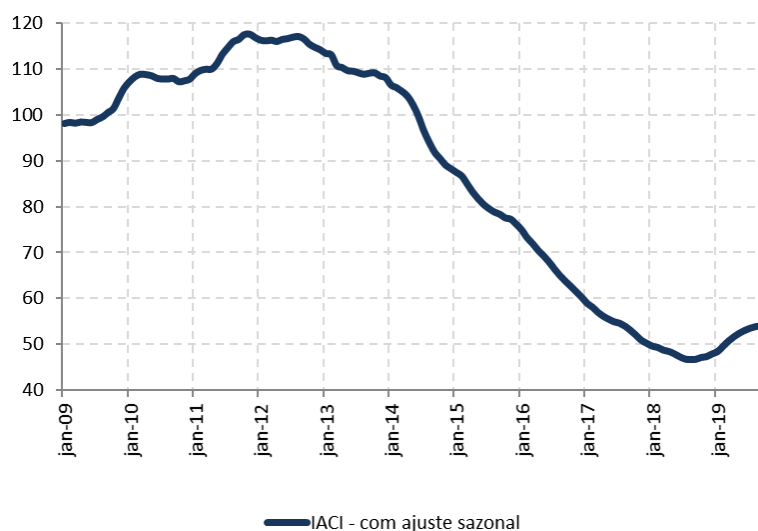
Figura 1: Índice de Atividade da Construção Imobiliária (IACI), com ajuste sazonal (média 2009=100)

A metragem quadrada em construção medida pelo IACI apresentou estabilidade em outubro ante setembro, na série com ajuste sazonal. Em relação ao mesmo período de 2018, houve crescimento de 14,6%. Dessa forma, o IACI registra crescimento de 9,0% no acumulado até outubro, frente ao mesmo período do ano passado.