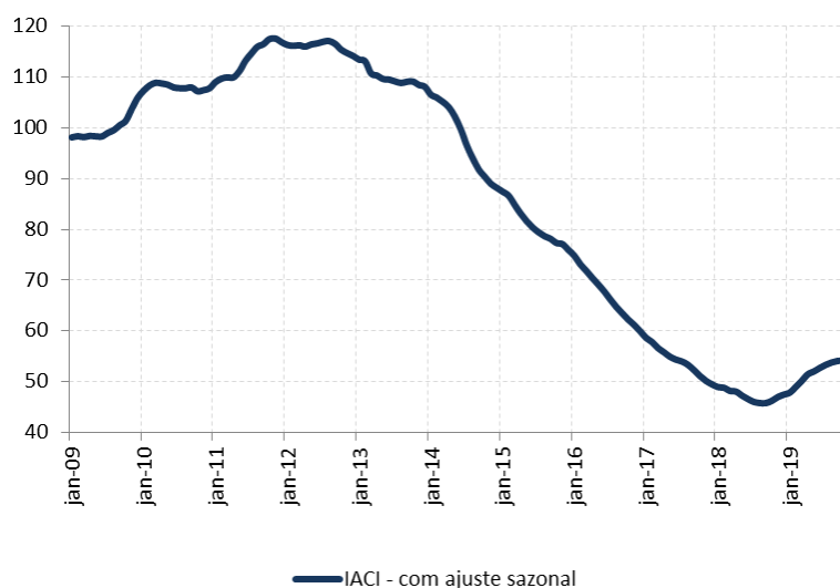
Figura 1: Índice de Atividade da Construção Imobiliária (IACI), com ajuste sazonal (média 2009=100)

A metragem quadrada em construção medida pelo IACI recuou 1,2% em novembro ante outubro, na série com ajuste sazonal. Em relação ao mesmo período de 2018, houve crescimento de 13,5%. Dessa forma, o IACI registra avanço de 10,4% no acumulado até novembro, frente ao mesmo período do ano passado.