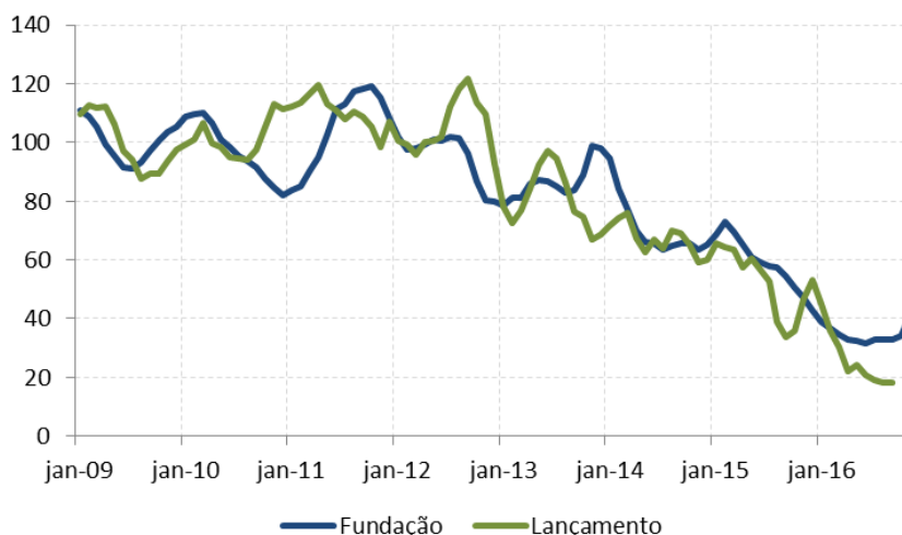
Figura 2: Índice de Atividade da Construção Imobiliária – Fundação (IACI-F) e Lançamento (IACI-L) com ajuste sazonal (média 2009=100)

A recente alta do IACI-F reflete a elevação dos lançamentos no final do ano passado e acompanha também o movimento de melhora pontual dos índices de confiança. Tal fato deve ter impacto positivo nas fases subsequentes da construção, estrutura e acabamento, no próximo ano. Por outro lado, a trajetória do IACI-F nos próximos meses deve ser limitada diante da conjuntura ainda bastante desfavorável e da forte queda observada nos índices de lançamentos ao longo de 2016.