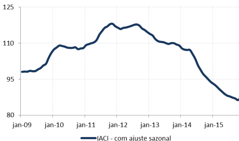
Figura 1: Índice de Atividade da Construção Imobiliária (IACI), com ajuste sazonal (média 2009=100)

O IACI de novembro mostrou alta de 1,0% ante outubro, considerando os dados livres de efeitos sazonais. Na comparação com novembro de 2014, o índice registrou retração de 8,1%. Com esse resultado, a atividade da construção imobiliária mostra queda de 13,1% no acumulado até novembro, ante o mesmo período do ano passado. No acumulado em 12 meses, o indicador recuou 13,2%, ante -8,2% no fechamento de 2014.