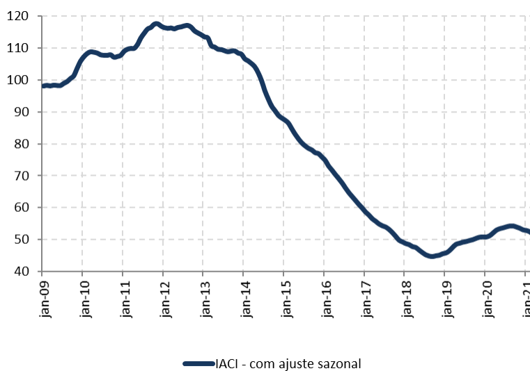
Figura 1: Índice de Atividade da Construção Imobiliária (IACI), com ajuste sazonal (média 2009=100)

A metragem quadrada em construção medida pelo IACI apresentou recuo de 1,6% em março ante fevereiro, na série com ajuste sazonal. Em relação ao mesmo período de 2020, houve queda de 0,8%.