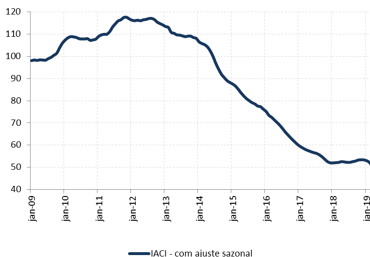
Figura 1: Índice de Atividade da Construção Imobiliária (IACI), com ajuste sazonal (média 2009=100)

A metragem quadrada em construção medida pelo IACI apresentou queda de 3,3% em março ante fevereiro, na série com ajuste sazonal. Em relação ao mesmo mês de 2018, houve recuo de 3,6%. Com esse resultado, a atividade da construção imobiliária recuou 2,7% no primeiro trimestre do ano ante o último trimestre de 2018, na série livre de efeitos sazonais. Em relação ao mesmo período do ano anterior, o indicador apresentou retração de 0,6%. Considerando dados na média móvel em 12 meses até mar/19, o IACI acumula recuo de 3,4%.