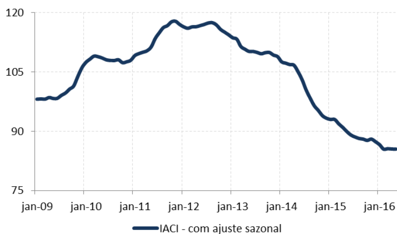
Figura 1: Índice de Atividade da Construção Imobiliária (IACI), com ajuste sazonal (média 2009=100)

A metragem quadrada em construção, medida pelo IACI, mostrou estabilidade em maio ante abril, na série com ajuste sazonal, mantendo a tendência observada nos últimos resultados. Na comparação com maio de 2015, o índice apresentou retração de 4,8%. Com esse resultado, a atividade de construção imobiliária mostra queda de 8,3% no acumulado em 12 meses.