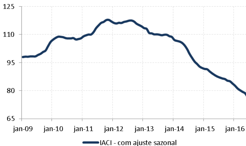
Figura 1: Índice de Atividade da Construção Imobiliária (IACI), com ajuste sazonal (média 2009=100)

A metragem quadrada em construção, medida pelo IACI, registrou queda de 2,6% em junho ante maio, cujo resultado foi revisado de estabilidade para queda de 0,9% na série com ajuste sazonal. Na comparação com junho de 2015, o índice apresentou recuo de 12,6%. Com esse resultado, a atividade de construção imobiliária acumula queda de 10,6% na média 12 meses.