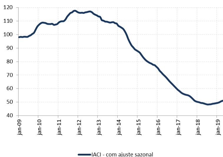
Figura 1: Índice de Atividade da Construção Imobiliária (IACI), com ajuste sazonal (média 2009=100)

A metragem quadrada em construção medida pelo IACI apresentou recuo de 1,4% em junho ante maio, na série com ajuste sazonal. Em relação ao mesmo mês de 2018, houve crescimento de 3,6%.