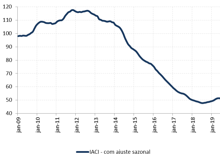
Figura 1: Índice de Atividade da Construção Imobiliária (IACI), com ajuste sazonal (média 2009=100)

A metragem quadrada em construção medida pelo IACI apresentou recuo de 2,2% em julho ante junho, na série com ajuste sazonal. Em relação ao mesmo mês de 2018, houve crescimento de 4,9%. Dessa forma, o IACI registra crescimento discreto de 3,7% no acumulado do ano até julho frente o mesmo período do ano passado.