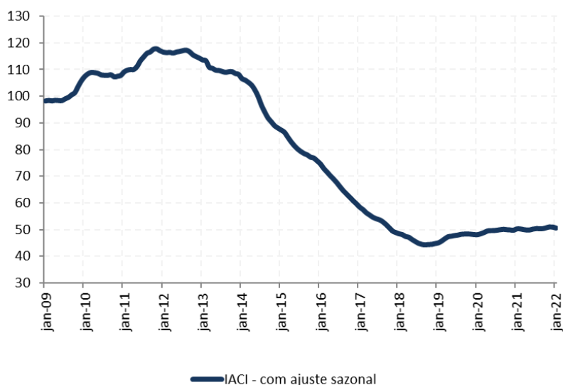
Figura 1: Índice de Atividade da Construção Imobiliária (IACI), com ajuste sazonal (média 2009=100)

A metragem quadrada em construção medida pelo IACI recuou 0,7% em janeiro ante dezembro, na série com ajuste sazonal. Em relação ao mesmo período de 2021, houve ligeiro avanço, de 0,6%.