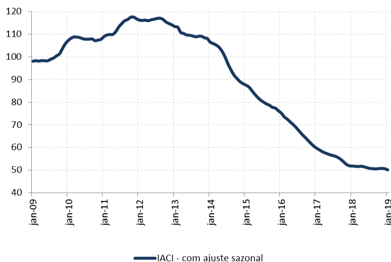
Figura 1: Índice de Atividade da Construção Imobiliária (IACI), com ajuste sazonal (média 2009=100)

A metragem quadrada em construção medida pelo IACI apresentou queda de 1,1% em janeiro ante dezembro, na série com ajuste sazonal. Em relação ao mesmo mês de 2018, houve recuo de 3,4%.