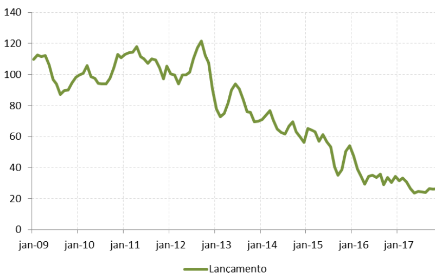
Figura 2: Índice de Atividade da Construção Imobiliária - Lançamentos (IACI-L) (taxa de crescimento acumulada em 12 meses até nov/17)

Considerando a média móvel trimestral até novembro, o IACI-L apresenta alta de +8,1%, mas segue ainda em patamares bastante deprimidos: no acumulado em 12 meses, a abertura registra queda de 23,9%. Os sinais de estabilidade do índice de lançamentos tendem a reforçar a tendência mais favorável observada nas fases seguintes à de lançamentos (Fundação, Estrutura e Acabamento).