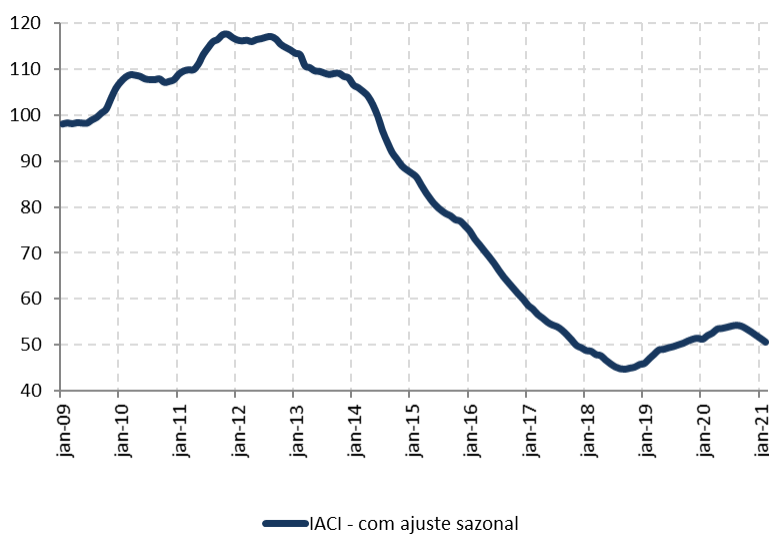
Figura 1: Índice de Atividade da Construção Imobiliária (IACI), com ajuste sazonal (média 2009=100)

A metragem quadrada em construção medida pelo IACI apresentou recuo de 1,5% em fevereiro ante janeiro, na série com ajuste sazonal. Em relação ao mesmo período de 2020, houve queda de 2,9%.