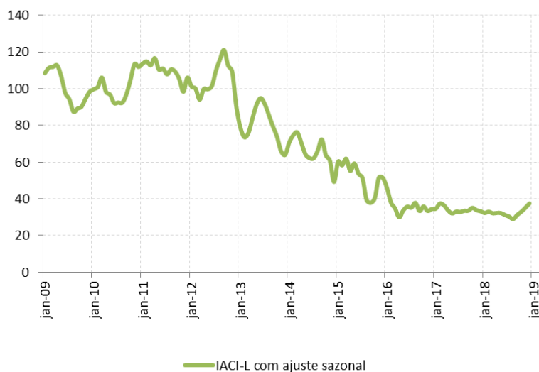
Figura 2: Índice de Atividade da Construção Imobiliária em Lançamento (IACI-L) com ajuste sazonal (média 2009=100)

Entre as aberturas, nota-se que os lançamentos de empreendimentos comerciais e de turismo, segmentos que foram bastante afetados pela crise do setor imobiliário, foram destaques negativos, tendo apresentado quedas de 46,2% e 85,8%, respectivamente, em 2018. As obras residenciais, por sua vez, registraram recuo mais discreto de 0,9% no ano passado.