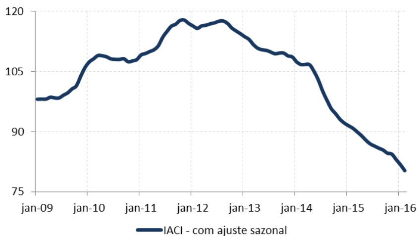
Figura 1: Índice de Atividade da Construção Imobiliária (IACI), com ajuste sazonal (média 2009=100)

A metragem quadrada em construção, medida pelo IACI, registrou queda de -1,8% em fevereiro ante janeiro, considerando os dados livres de efeitos sazonais. Na comparação com fevereiro de 2015, o índice recuou 11,6% enquanto que, no acumulado em 12 meses, o IACI registra retração de 12,9%. Assim, a atividade da construção imobiliária segue em retração, sem perspectiva de reversão diante da trajetória negativa dos principais condicionantes do mercado imobiliário.