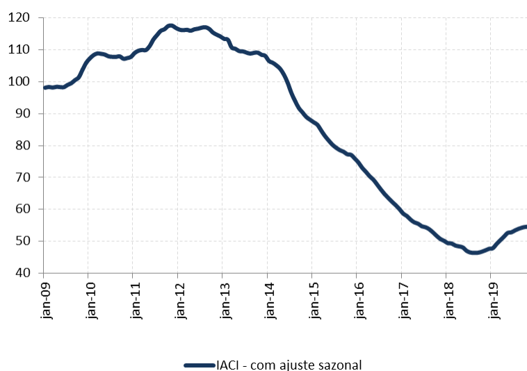
Figura 1: Índice de Atividade da Construção Imobiliária (IACI), com ajuste sazonal (média 2009=100)

A metragem quadrada em construção medida pelo IACI recuou 3,2% em dezembro ante novembro, na série com ajuste sazonal. Em relação ao mesmo período de 2018, houve crescimento de 10,3%.