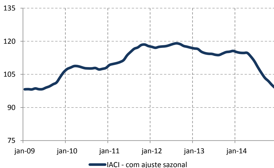
Figura 1: Índice de Atividade da Construção Imobiliária (IACI), com ajuste sazonal (média 2009=100)

Com a incorporação deste dado o quatro trimestre do ano fechou com queda de 13,1% na comparação com o mesmo período do ano passado, e de 5,2% em relação ao terceiro trimestre, considerando o ajuste sazonal.