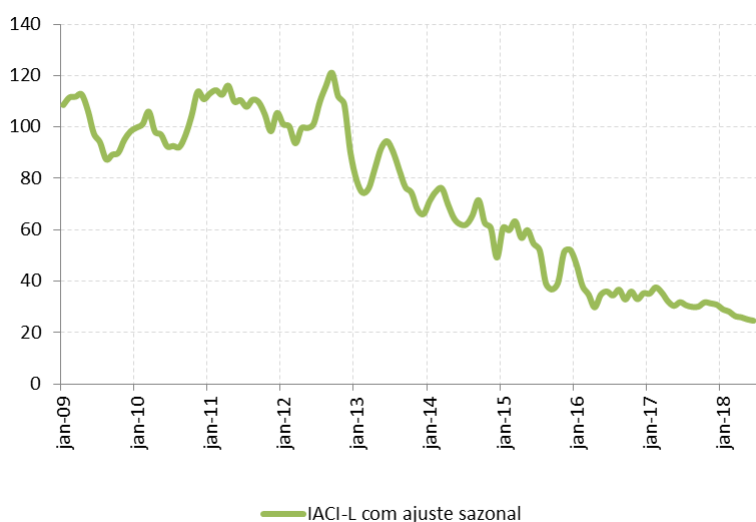
Figura 2: Índice de Atividade da Construção Imobiliária: Lançamentos (IACI-L) , com ajuste sazonal (média 2009=100)

Em junho, o índice de lançamentos (IACI-L), apurado com dois meses de defasagem em relação aos demais índices do MCC, apresentou queda de 2,1% ante maio, quando registrara -3,0% na margem dessazonalizada. Com o resultado do mês, o indicador encerrou o segundo trimestre do ano com recuo de 9,4% ante o 1T18, também na série dessazonalizada. No primeiro semestre, o IACI-L acumula -21,5% frente a mesmo período de 2017.