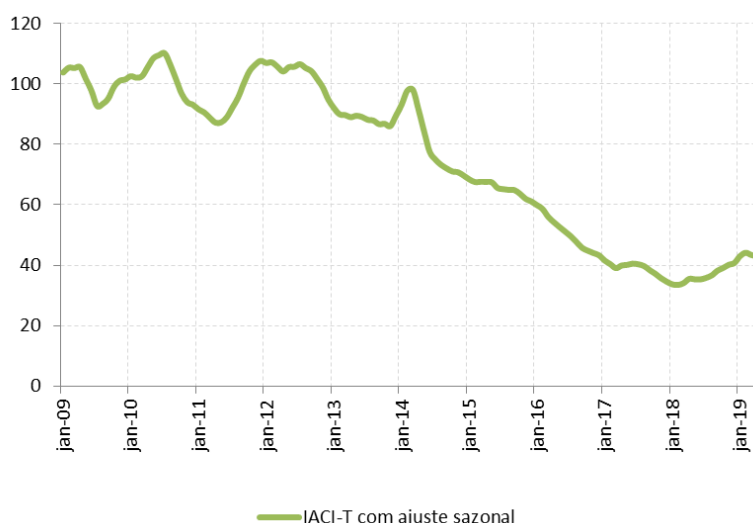
Figura 2: Índice de Atividade da Construção Imobiliária em Estrutura (IACI-T) com ajuste sazonal (média 2009=100)

Entre as aberturas, podem ser observadas dinâmicas geográficas bastante divergentes. As regiões Centro-Oeste, Sul e Sudeste têm exibido recuperação, com destaque para a última, que acumula crescimento de 14,1% na média móvel em 12 meses até abril de 2019. Por outro lado, o indicador permanece em patamar bastante depreciado no Norte e no Nordeste, tendo anotado quedas de 5,3% e -7,6%, respectivamente, na mesma base de comparação.